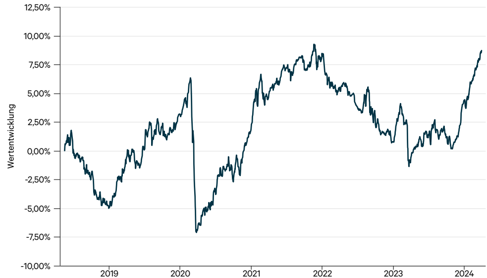
— C-QUADRAT ARTS Total Return Defensive H