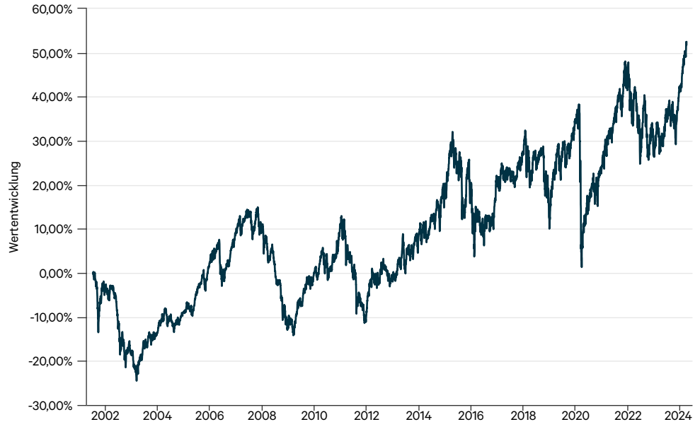
— I-AM ETFs-Portfolio Select EUR (t)