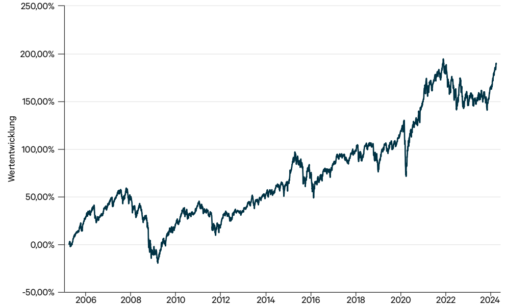
— CT Welt Portfolio AMI CT (a)