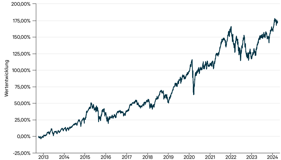
— Wagner & Florack Unternehmerfonds AMI I (a)