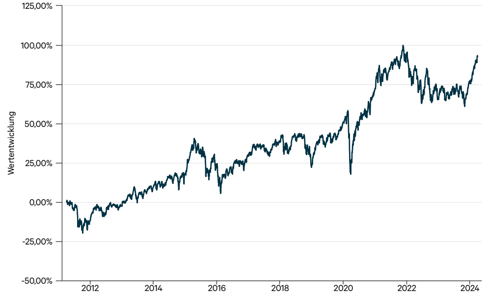
— CT Welt Portfolio AMI PT (a)