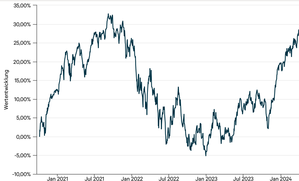
— Quant IP Global Patent Leaders P (a)