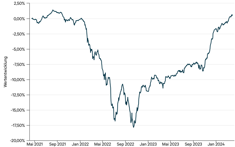
— Ampega Credit Opportunities Rentenfonds P (a)